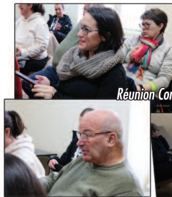
Réunion Comité des fêtes